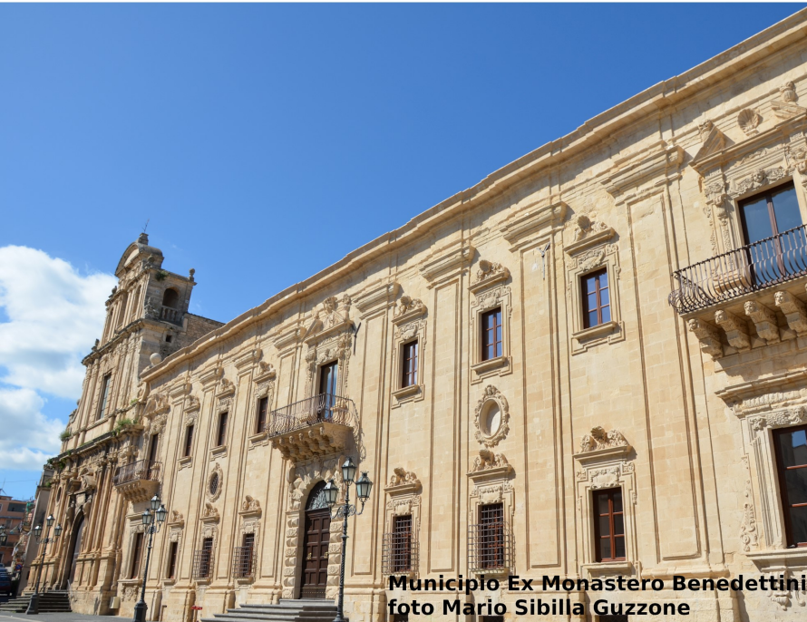
Municipio Ex Monastero Benedettini

Completamento del percorso di visita alle ore 13:30