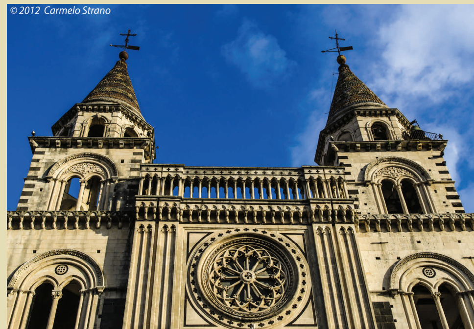
Cattedrale di Acireale