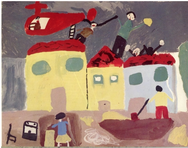
Tratta da 'Com'era l'acqua, i bambini di Firenze raccontano', La nuova Italia, Firenze, 1967